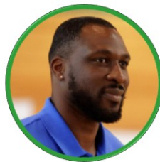
FLORENT PIETRUS FRANCE - BASKETBALL