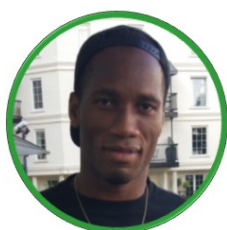
DIDIER DROGBA IVORY COAST - FOOTBALL