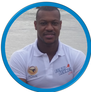
Daba Modibo Keita (Taekwondo, 2x Champion du Monde, Mali)

Le 22/05/2007, au championnat du Monde de Taekwondo, Daba Modibo Keita devient le premier représentant d'Afrique sub-saharienne à remporté un titre. Ayant connu la guerre et l'exil, le sport lui offre une nouvelle dynamique. Porte drapeau de la délégation Malienne aux JO de Pékin, il devient ambassadeur des Sports et de la lutte contre le VIH au Mali. Son association œuvre pour le développement à travers les valeurs fondamentales du sport. Il soutiendra la « Caravane de la Paix ».