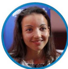
SARAH OURAHMOUNE FRANCE - BOXING