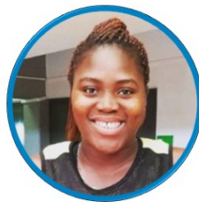
ISABELLE YACOUBOU FRANCE - BASKETBALL