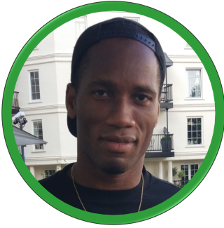
Didier Drogba (Football, Vainqueur de l'UEFA Champions League Côte d'Ivoire)

En octobre 2005, après la première qualification de la Côte d'Ivoire pour une phase finale de Coupe du Monde, le capitaine des « Eléphants » s'adresse à son peuple alors que la guerre civile gronde. Cet « Appel de Khartoum » est le premier acte de réconciliation Ivoirienne. Il crée sa Fondation en 2007, faisant don de tous ses revenus commerciaux pour des actions améliorant l'accès à la santé et à l'éducation. Il est ambassadeur de la « Caravane de la Paix ».